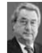
Dr. Dieter Hundt Arbeitgeberpräsident

* Stifter: BruderhausDiakonie Reutlingen; Diakonie Stetten; Evangelisches Diakoniewerk Schwäbisch Hall; Evangelische Gesellschaft Stuttgart; Evangelische Heimstiftung; Mariaberger Heime; Nikolauspflege Stuttgart; Samariterstiftung Nürtingen; Zieglersche Anstalten Wilhelmsdorf