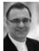
Frank O. July Landesbischof